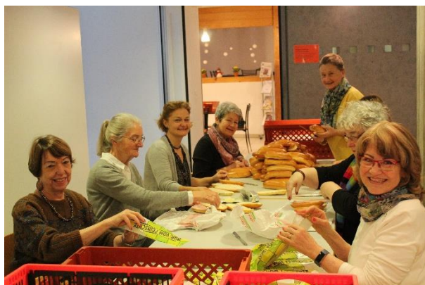
Seniorenachmittag - Helferteam