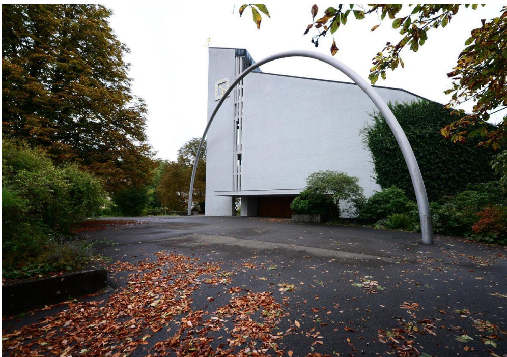
Die Kirche Rosenberg steht seit Anfang 2018 leer. Zuvor wurde sie nicht nur für Gottesdienste, sondern auch als Flüchtlingsunterkunft genutzt.

Der Stadtverband der reformierten Kirchen von Winterthur hat der Kirchgemeinde Veltheim einen Sonderbeitrag von 36'000 Franken zugesagt, um die Kirche Rosenberg zu einem Proberaum umzufunktionieren. «Allein das Heizen der Kirche in der Winterperiode kostet rund 15'000 Franken», erklärt Jedele. Darüber hinaus seien verschiedene Unterhaltsarbeiten fällig: «Zum Beispiel bei den sanitären Anlagen. Die müssen nach dem Leerstand wieder in Betrieb genommen werden.»